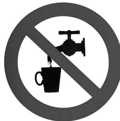
KD5: Symbol (Ø=5cm)